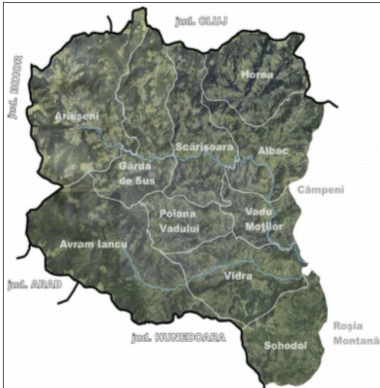
Fig. 1. Țara Motilor