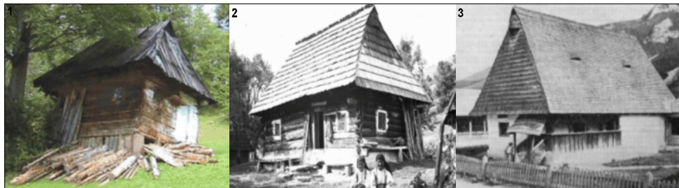
Fig. 3. Case moțești

Elementul de noutate la acest tip de locuință îl constituie apariția scărilor de lemn protejate cu un acoperiș din șindrilă, care va deveni un alt element specific locuinței moțului. Materialul folosit atât la construirea locuinței cât și la acoperis este lemnul.