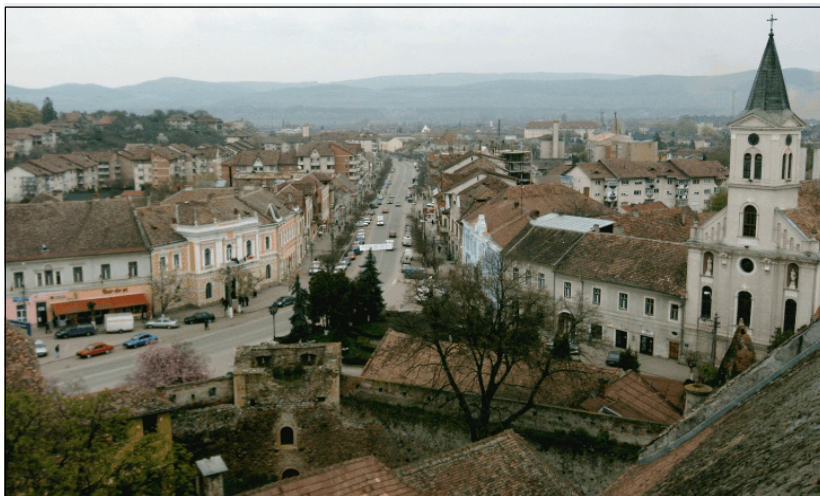
Fig. 1. Aiud, văzut de pe Dealul Panța

În procesul de evaluare a structurii sistemelor se operează cu: