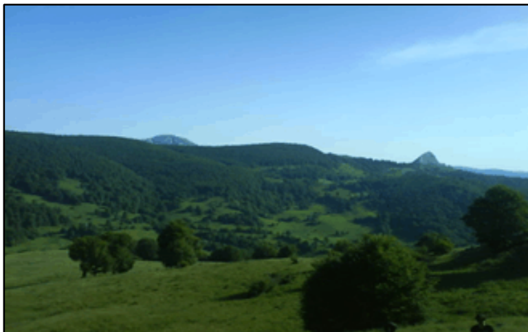
Fig. 1. Peisaj din Apuseni

Geologic, morfografic, morfometric si biopedoclimatic zona Apusenilor din judetul Alba prezinta o mare diversitate si varietate care a influentat caracteristicile mediului geografic, potentialul economic, gradul de populare, modul de viata si organizare a spatiului montan de-a lungul timpului. (fig.1).