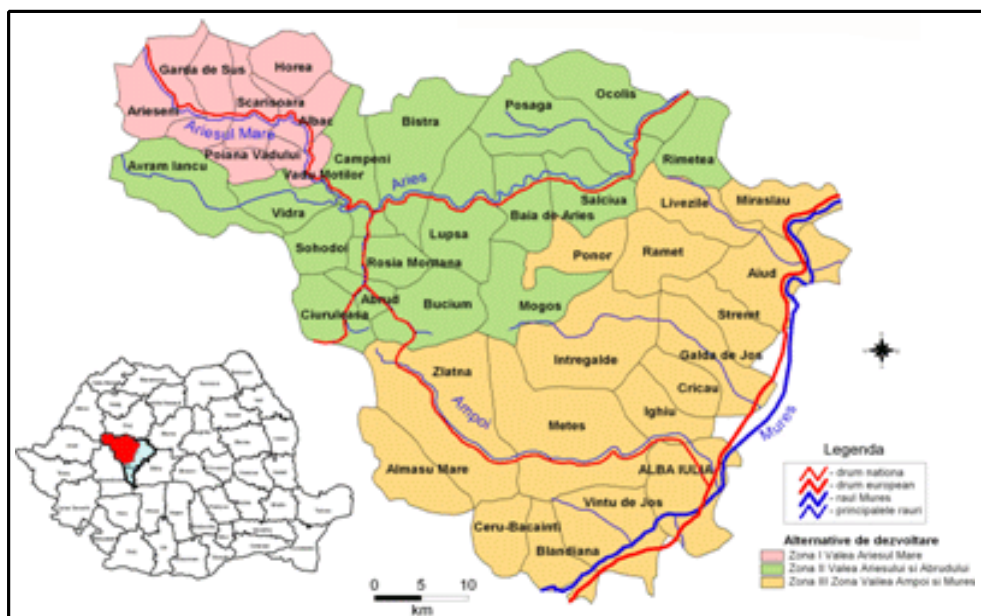
Fig. 3. Alternative de dezvoltare durabila in Muntii Apuseni din județul Alba

unor centre urbane polarizatoare mai mari, precum Alba Iulia si Aiud, care le pot influenta dezvoltarea, celelalte comune din Apuseni vor pastra un anumit specific in dezvoltarea si evolutia lor in functie de traditii, resurse si potentialul local care le pot face atractive mai ales din punct de vedere al turismului.