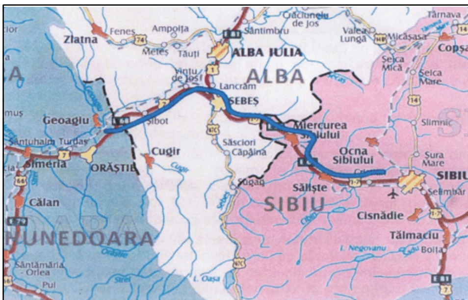
Fig. 2. Traseul autostrăzii Sibiu-Deva

Așadar, cu o infrastructură edilitară adecvată, dezvoltarea economică a acestui municipiu se va realiza cu pași tot mai mari, chiar dacă, prin statutul de oraș regal pe care l-a deținut în epoca medievală și ulterioară, Sebeșul a cunoscut deja o remarcabilă dezvoltare socio-economico-culturală care și-a lăsat puternic amprenta asupra municipiului zilelor noastre.